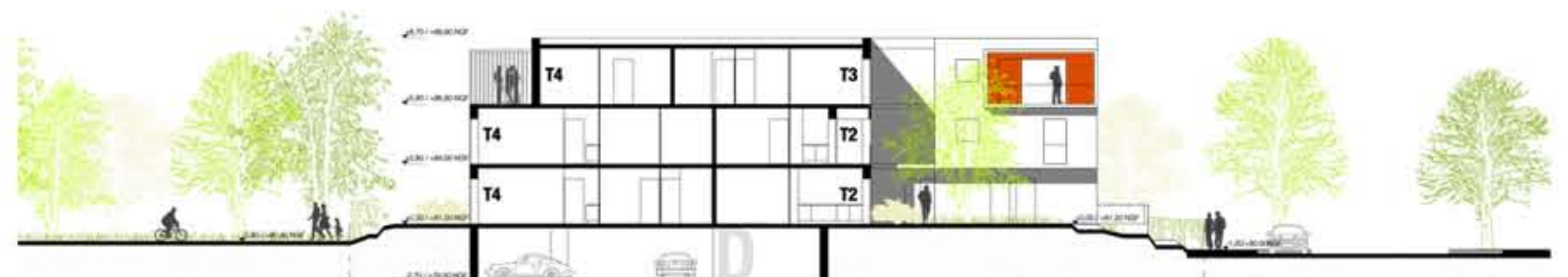
coupe transversale AA _ échelle 1/200e.