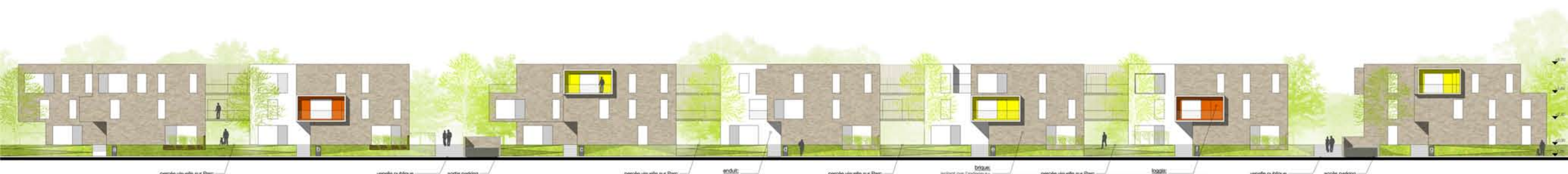
élévation Sud depuis rue des Trois Parts _ échelle 1/200e.