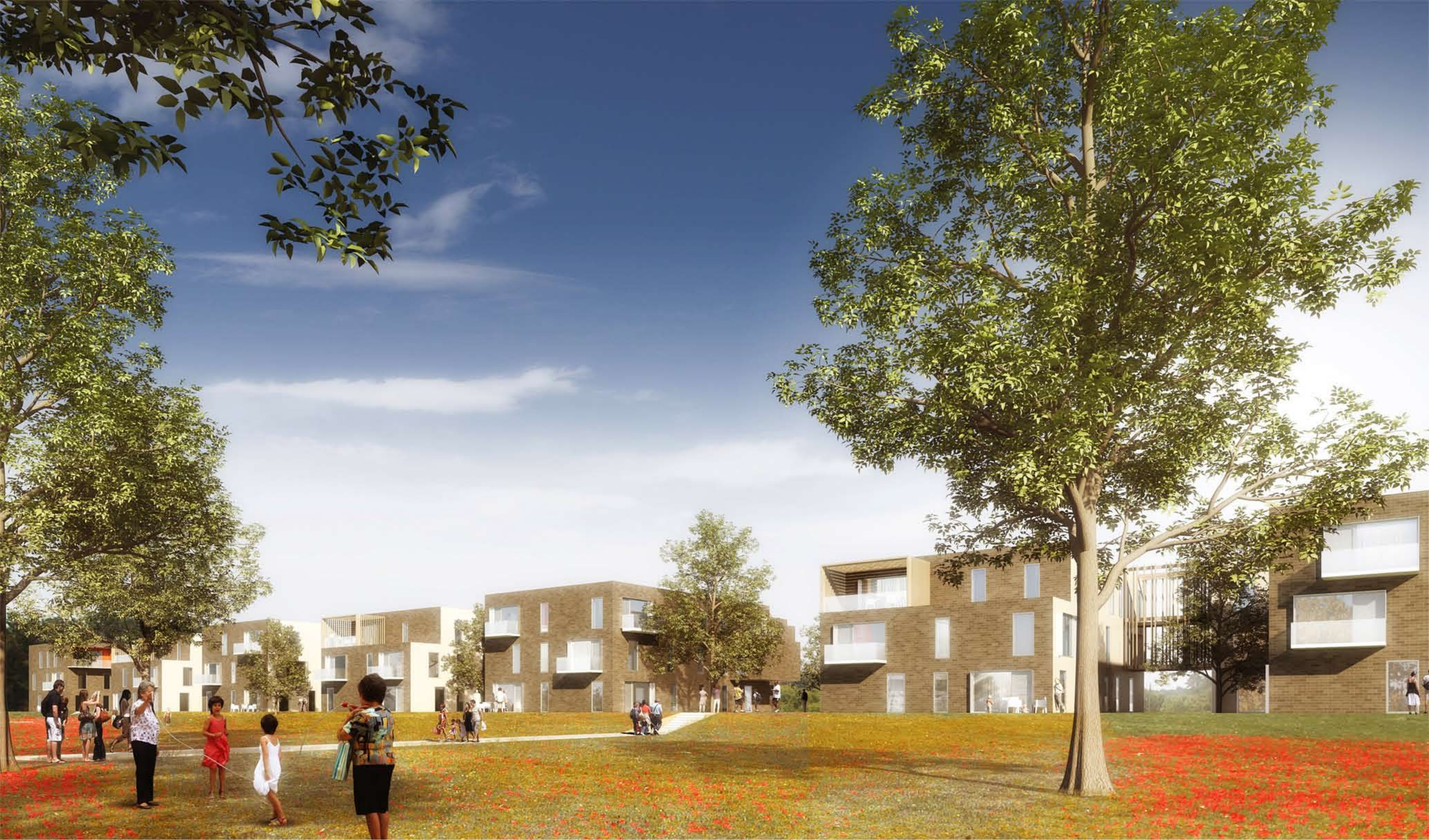
vue 1_ perspective depuis le Parc des Trois Parts