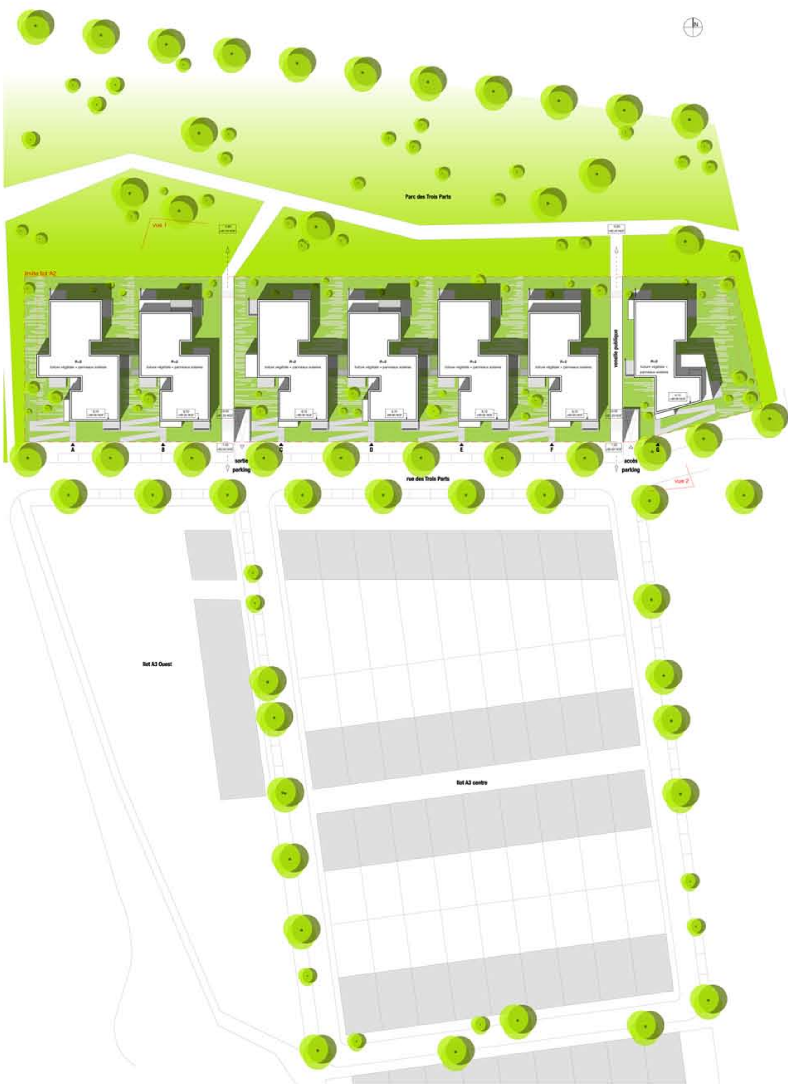
plan masse _ échelle 1/500e.