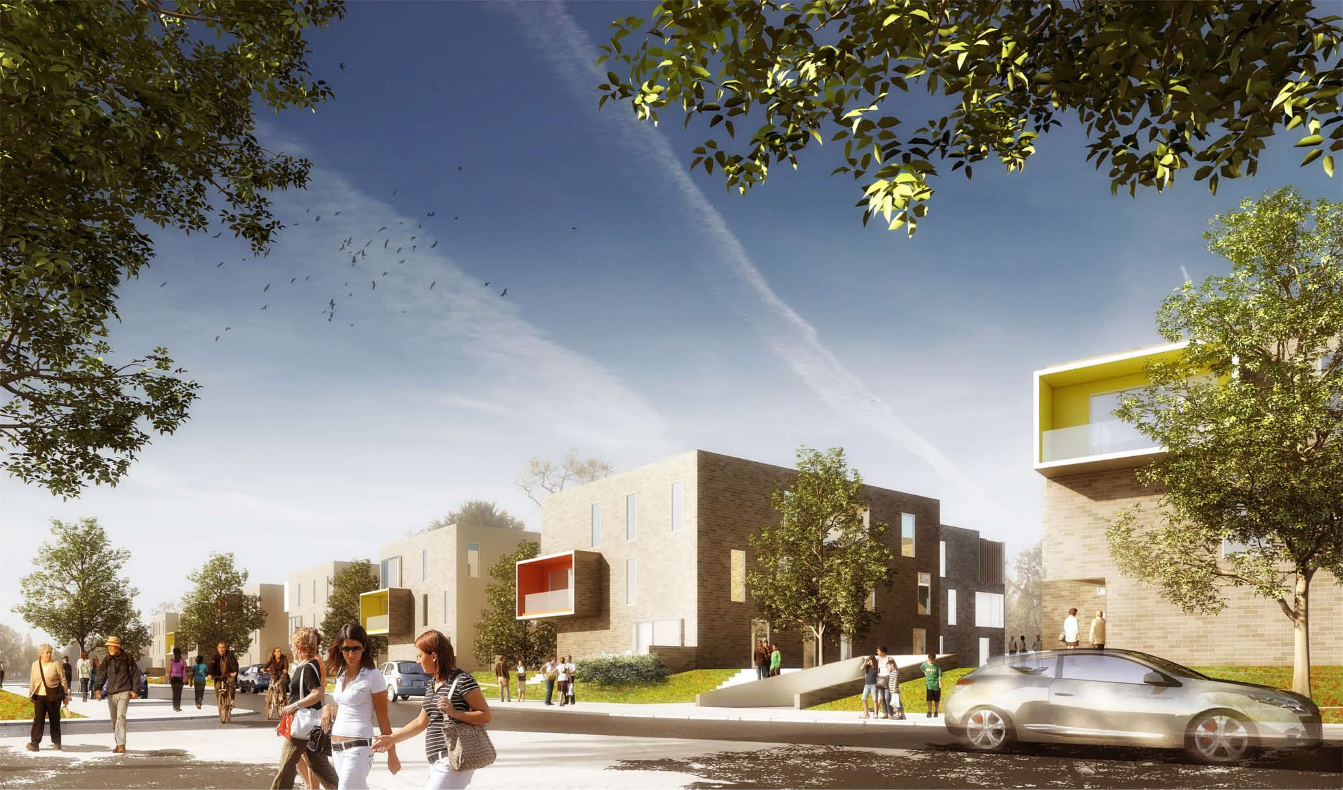
vue 2_ perspective depuis la rue des Trois Parts