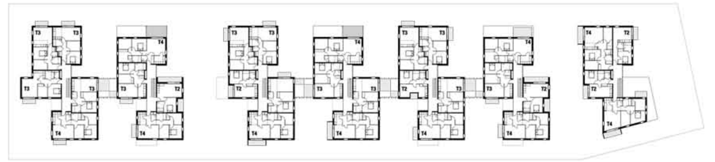
plan de niveau R+2 _ échelle 1/500e.