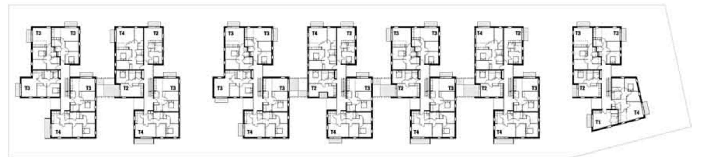
plan de niveau R+1 _ échelle 1/500e.