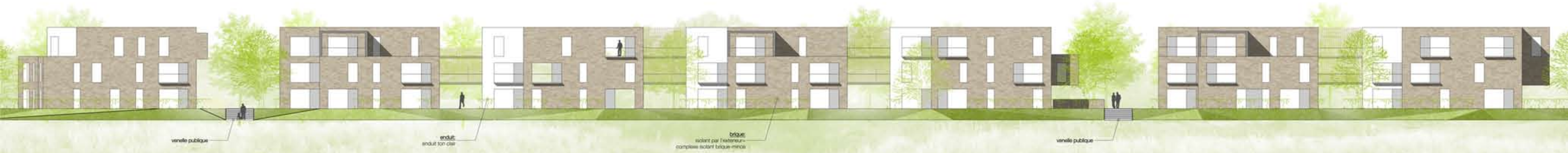
élévation Nord depuis Parc des Trois Parts _ échelle 1/200e.