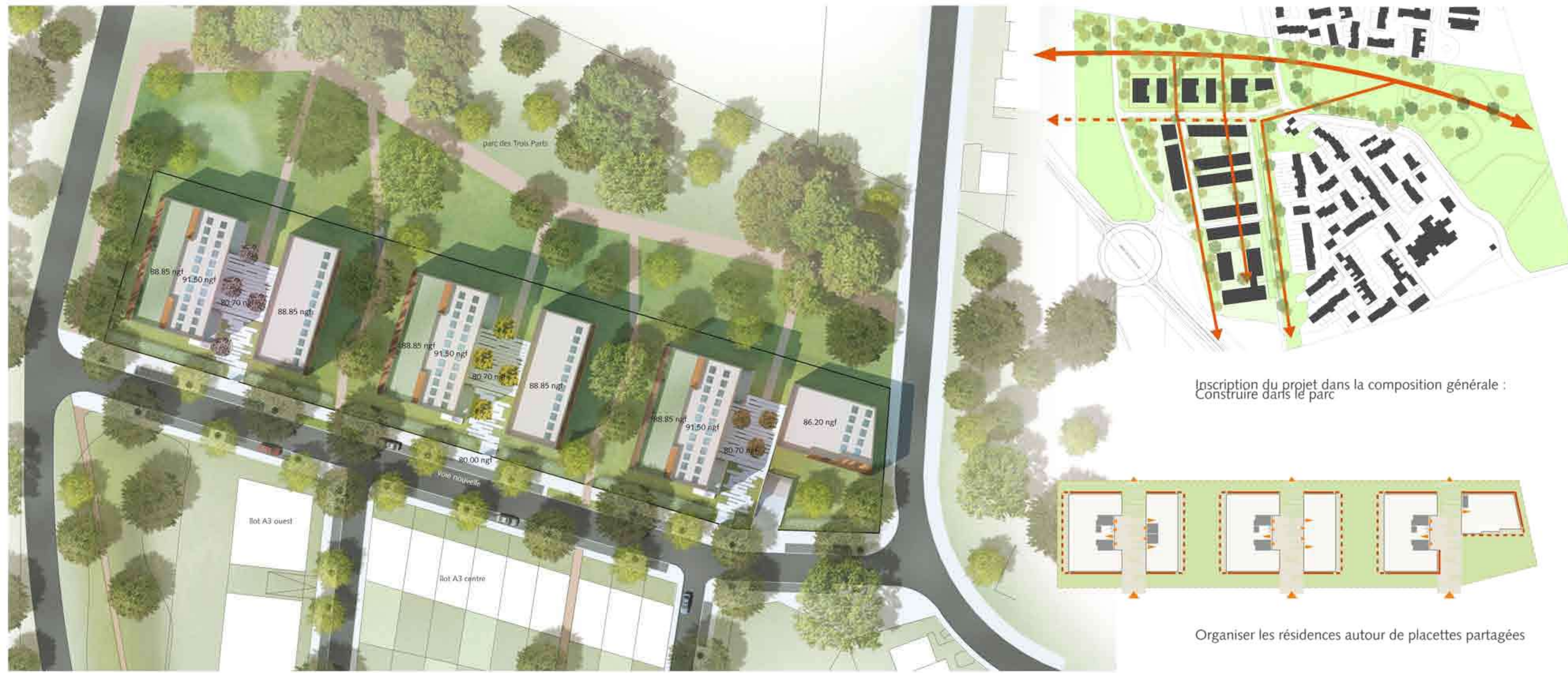
Plan de masse - échelle 1/500 : l'archipel des unités résidentielles à la confluence des parcs