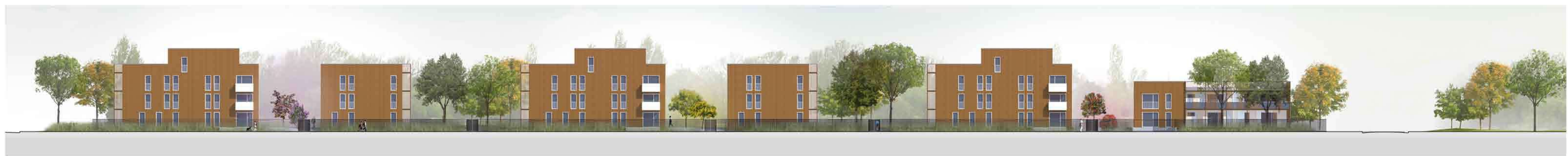
Façade sud - échelle 1/200 : le parc se glisse entre les îlots pour rayonner sur l'espace public et les maisons de l'îlot «A3 centre»