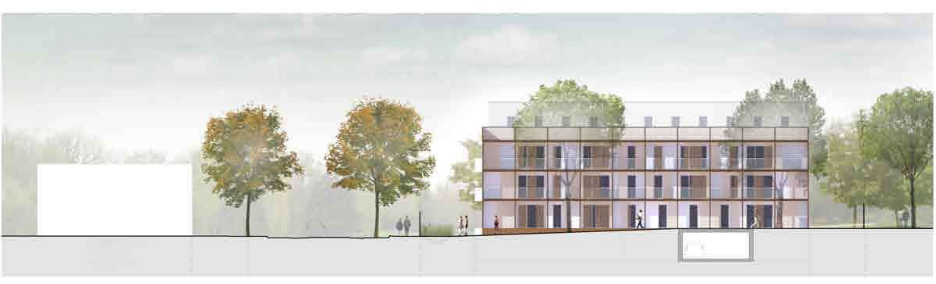
Façade ouest - échelle 1/200 : les logements bénéficient de balcons ouvert sur les prolongements du parc