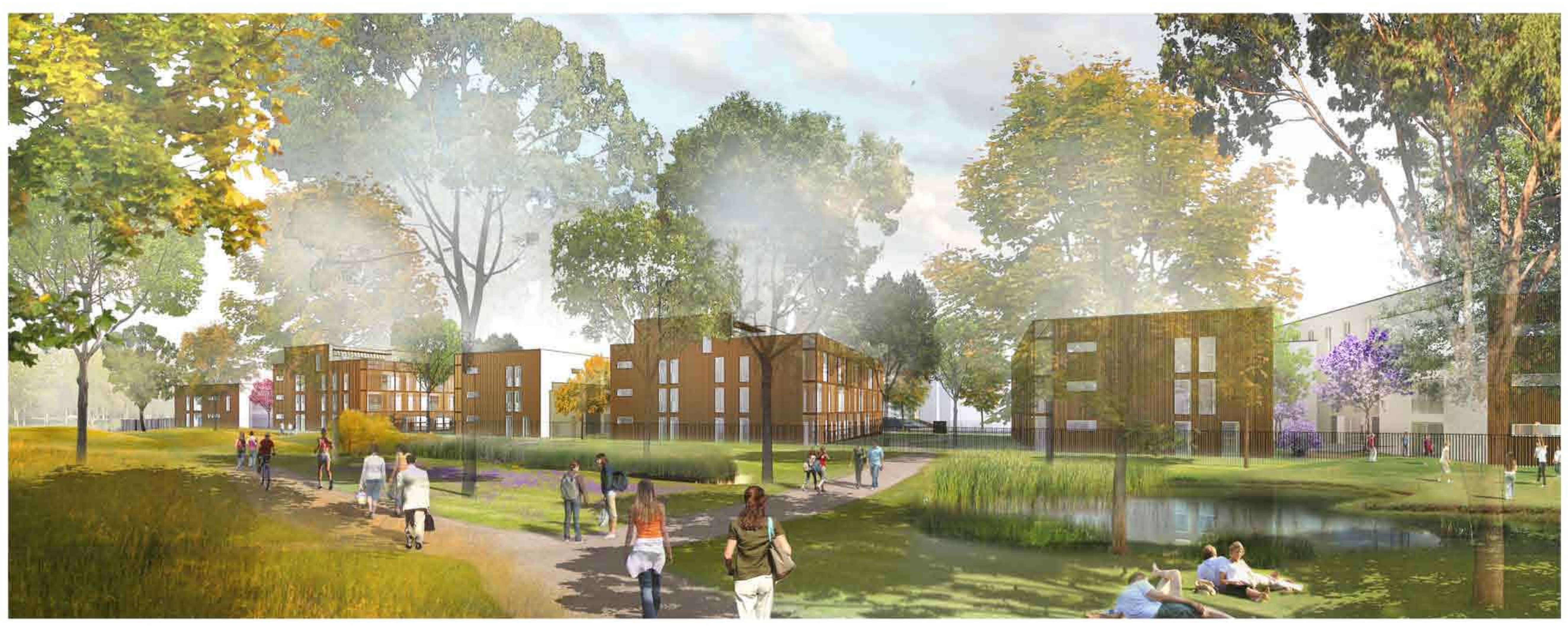
Vue depuis le parc des Trois Parts : habiter Bondoufle pour vivre au contact permanent d'une nature généreuse