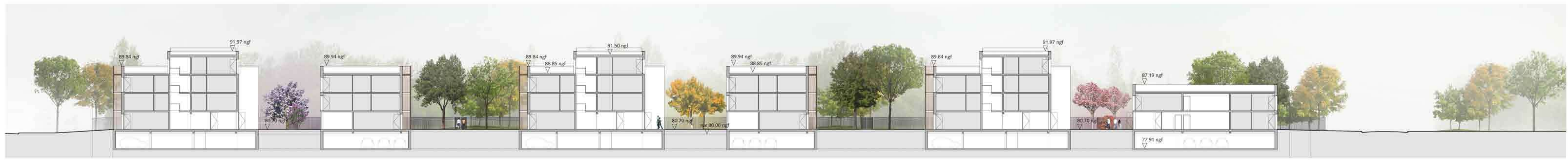
Coupe longitudinale - échelle 1/200 : une alternance de volumes mesurés qui libère les espaces d'épanouissement de la nature