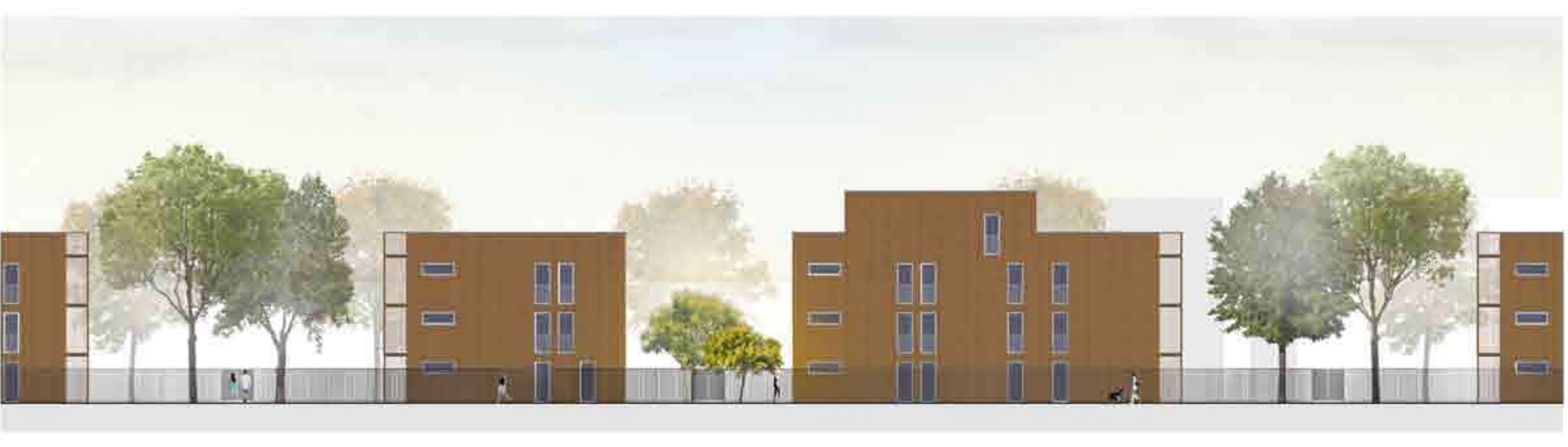
Façade nord - échelle 1/200 : les ouvertures mesurées cadrent le paysage du parc