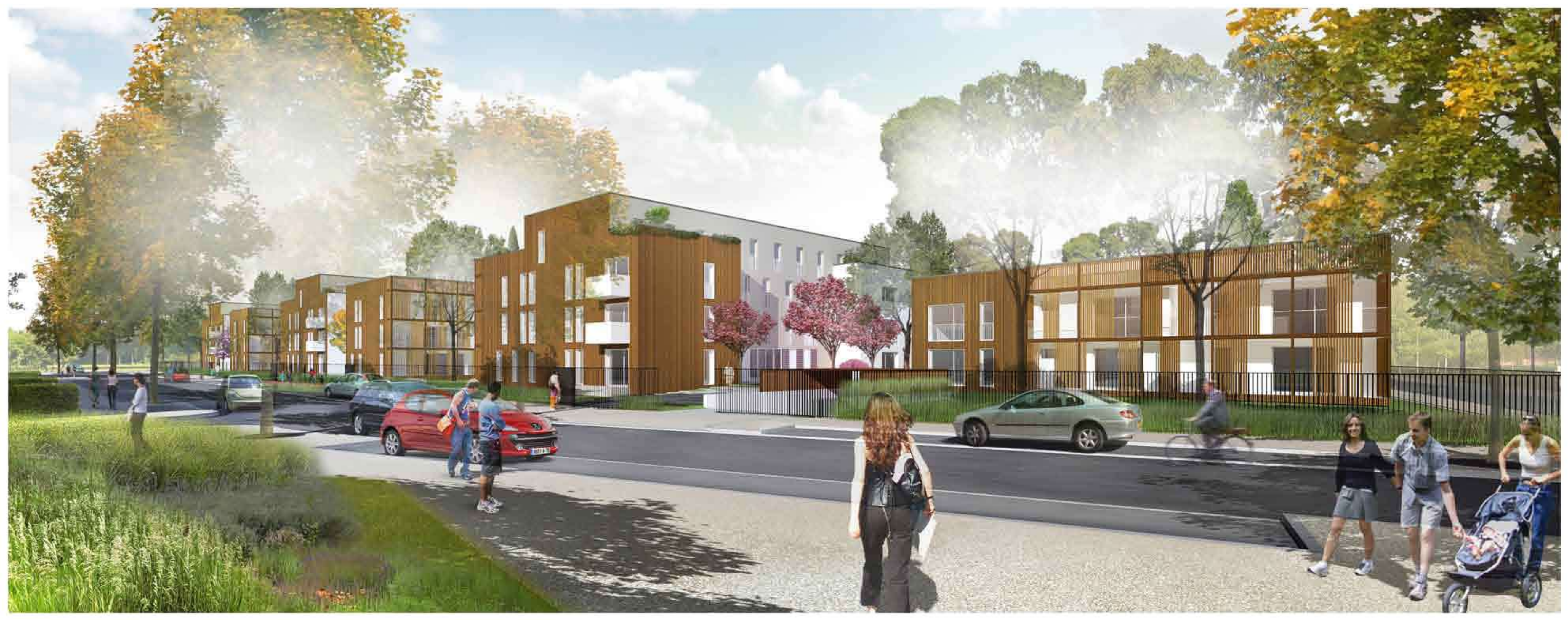
Vue depuis la rue d'accès : la douceur d'un paysage urbain née de l'alliance des résidences au parcs et aux jardins