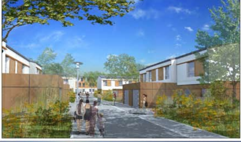
Perspective 3 - Maisons de Ville