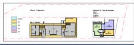
Niveau 2 & Attique