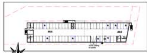
Plans schématiques - Etages Ilôt A3 Ouest Echelle: 1/500ème