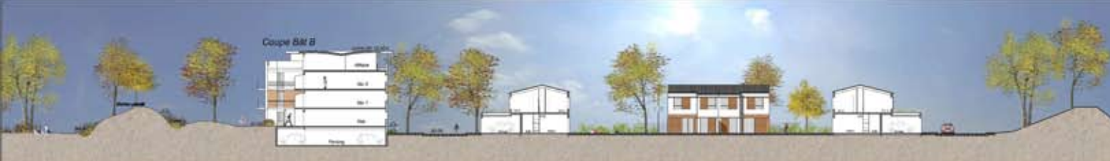
Coupe Transversale - Ilôt A3 Ouest