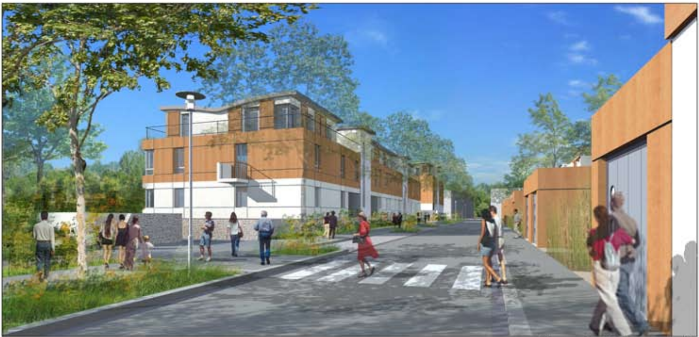
Perspective 4 - Vue sur collectifs