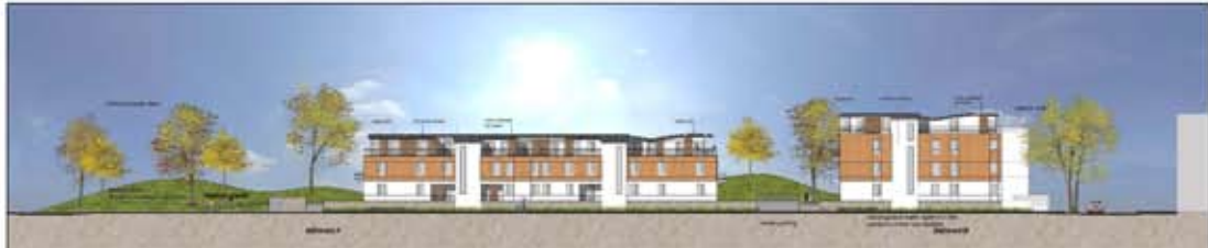
Façade Est - Ilôt A3 Ouest