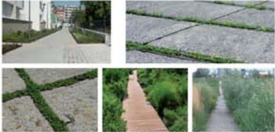
LES VOIES DE CIRCULATION ET LES USAGES PIETONNIERS