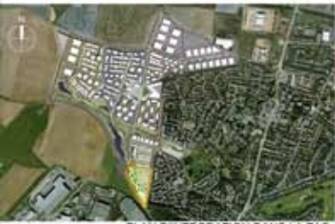
PLAN D'INTEGRATION DANS LA ZAC