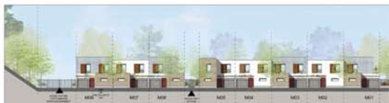
FACADE NORD - 1/200