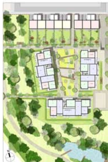
PLAN DU R+1 - 1/500