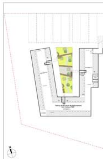
PLAN DU SOUS-SOL - 1/500