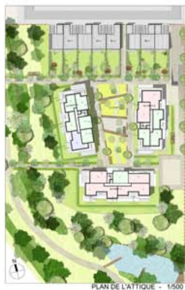
PLAN DE L'ATTIQUE - 1/500