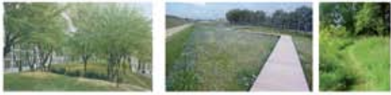
LES SECTEURS DU PROJET