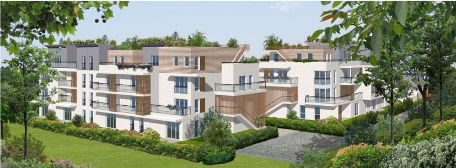
PERSPECTIVE 2 - VUE DEPUIS LE MERLON EXISTANT