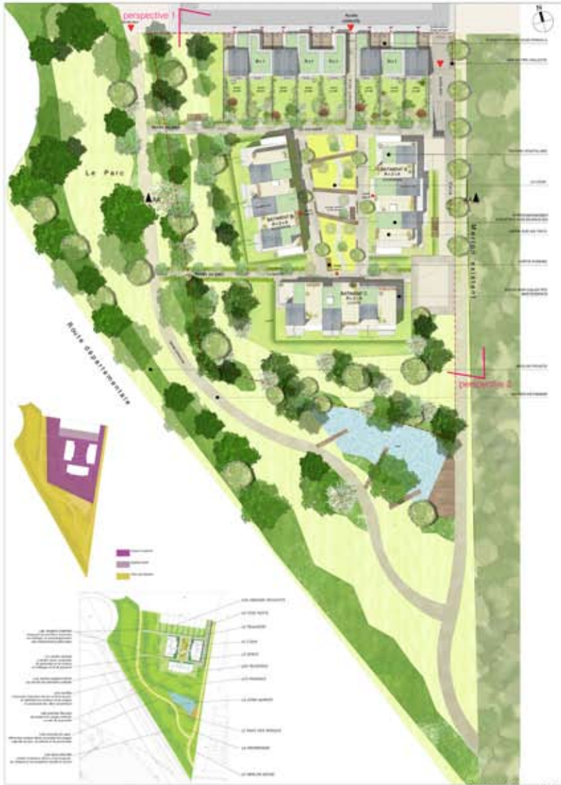
PLAN MASSE - 1/400