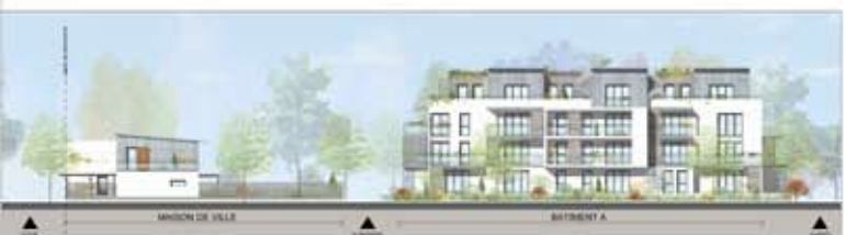
FACADE OUEST - 1/200