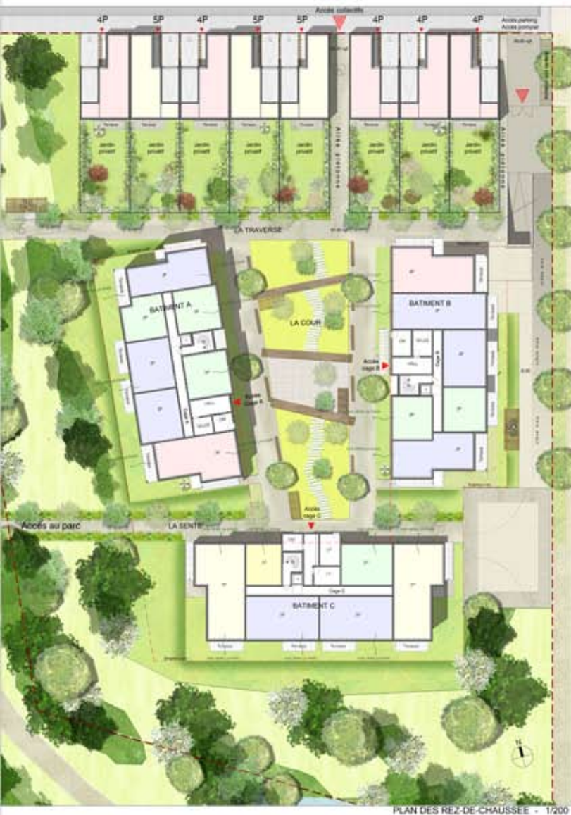
PLAN DES REZ-DE-CHAUSSEE - 1/200