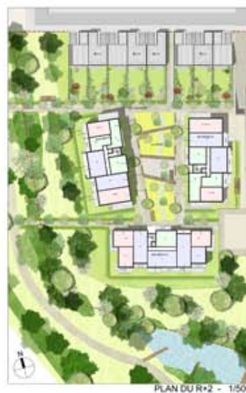
PLAN DU R+2 - 1/500