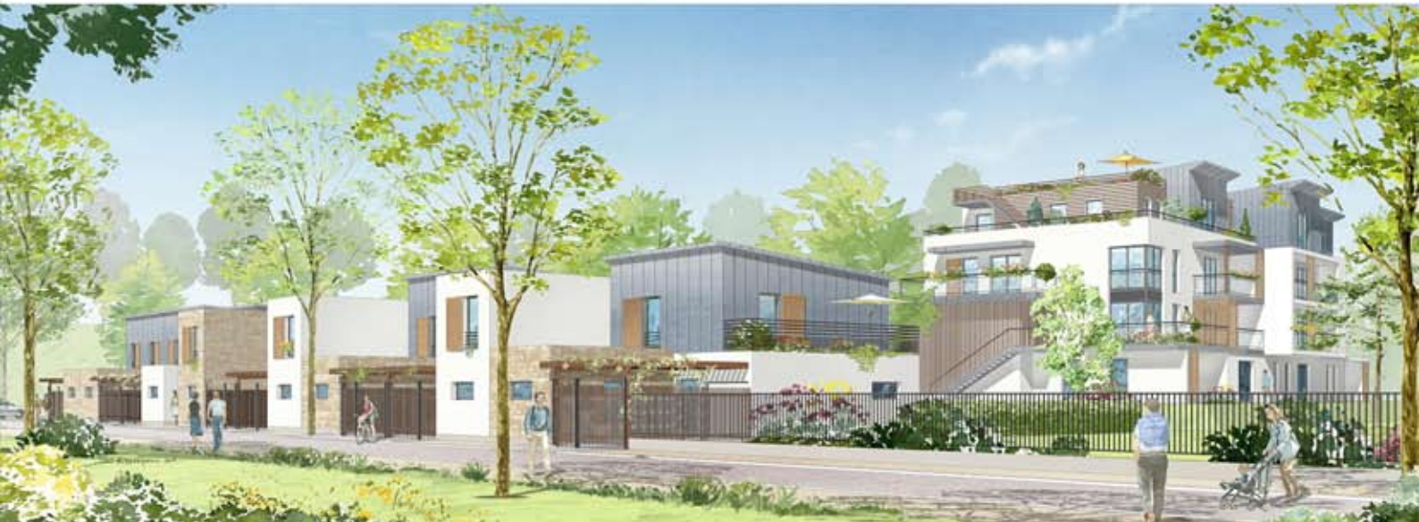
PERSPECTIVE 1 - VUE DEPUIS LA RUE