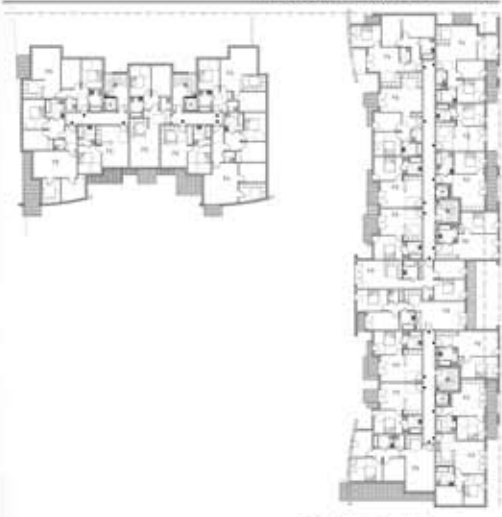
PLANS COURANTS 250°