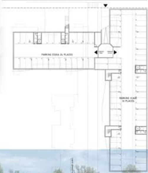
PLAN DU R-1 250°