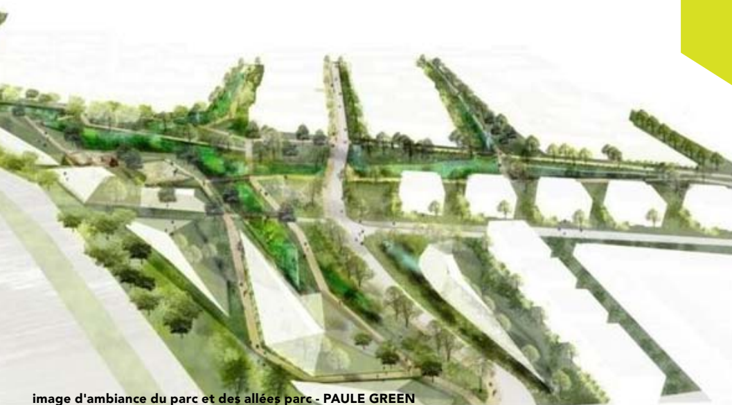
image d'ambiance du parc et des allées parc