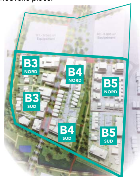
Maquette de travail illustrant les évolutions de la Tranche B au fil des ateliers

DÉCOUVREZ LES PROJETS DES ARCHITECTES LE 3 JUIN EN RÉUNION PUBLIQUE.